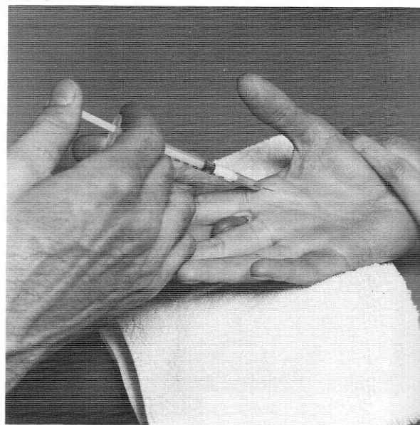
Afbeelding 13-61 Injectie van een trigger finger.

Hoewel niet altijd succesvol, is het injecteren van een trigger finger het proberen waard, daar soms de klachten langere tijd of zelfs permanent wegblijven.