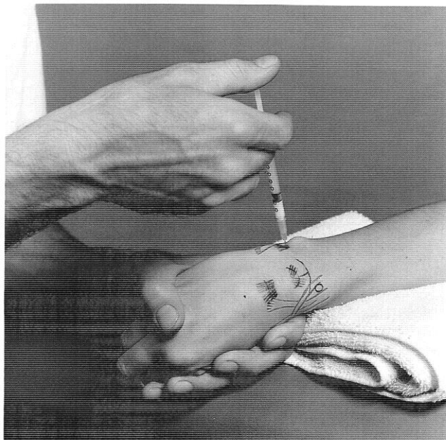
Afbeelding 13-17 Infiltratie van het lig. collaterale ulnare, de aanhechting aan de processus styloideus ulnae.

Overrekking van het lig. collaterale carpi ulnare is meestal het gevolg van een Collesfractuur. Dwarse friktie is gewoonlijk zeer effectief (drie of vier behandelingen), zie en vergelijk de uitvoering bij de dwarse friktiebehandeling van het lig. collaterale carpi radiale op blz. 276. Slechts in het zeldzame geval dat na zes behandelingen nog geen verbetering geconstateerd wordt, is infiltratie geïndiceerd.