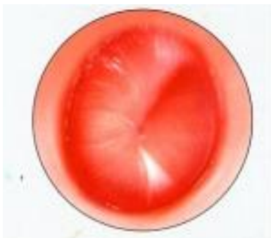
Ontstoken trommelvlies gespannen door vocht

Een ontsteking van het middenoor begint meestal met een verkoudheid. Dan zwelt het slijmvlies van de neus-/keelholte op. Hierdoor kan de verbinding tussen neus-/keelholte en middenoor (de buis van Eustachius) dichtgaan. Het middenoor is dan afgesloten. Virussen of bacteriën in het middenoor kunnen zich dan gaan vermenigvuldigen. Zo vormt zich een ontsteking, die vaak gepaard gaat met koorts. Door de ontsteking ontstaat vocht. Het vocht kan niet weg omdat de buis van Eustachius dichtzit. Door de ophoping van vocht komt er druk op het trommelvlies te staan en dat doet pijn.