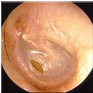
Trommelvlies na spontane ontlasting, perforatie heelt in 1 a 2 weken.

Soms breekt het trommelvlies open en loopt het ontstekingsvocht naar buiten. De pijn verdwijnt dan meestal snel. Het trommelvlies gaat daarna vanzelf weer dicht.