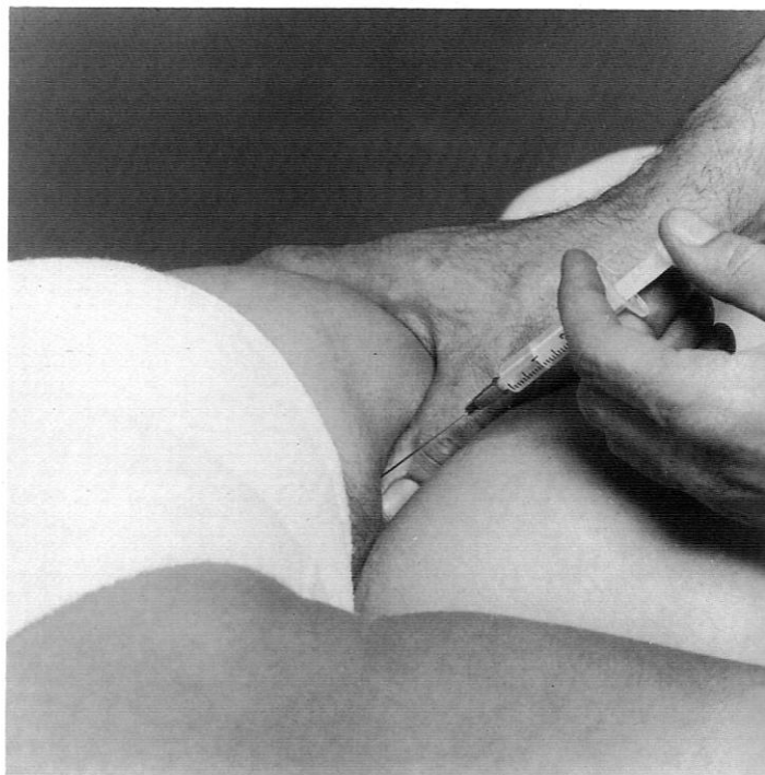
Afbeelding 15-34 Infiltratie van de bursa ischiadica.

Differentiatie van S 1 - of S 2 -wortelsyndromen of een insertie-tendopathie van de hamstrings is gewoonlijk niet moeilijk ( zie deel 2, Diagnostiek ).